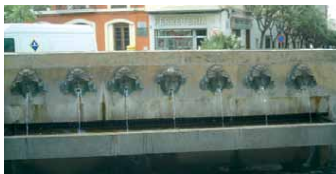
Plaça de les Fonts